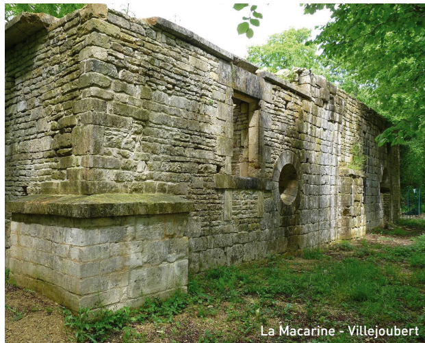
La Macarine - Villejoubert

6 Prenez à droite et faire 150 mètres pour arriver au site de la Macarine (ruines/privé). Il s'agit des ruines d'une ancienne chapelle du XII e siècle, à l'emplacement supposé de l'Ermitage de Saint-Amant. Une association locale œuvre à sa sauvegarde.