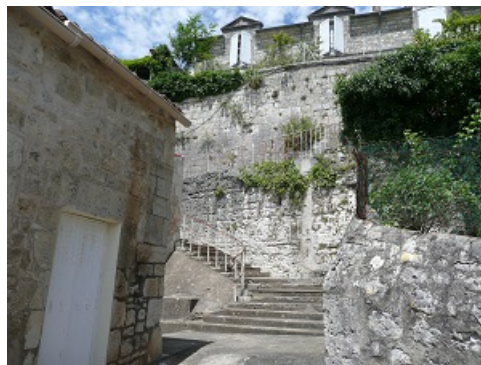
Le lavoir de Barbaras