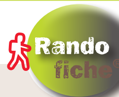
Bois du Châtelard