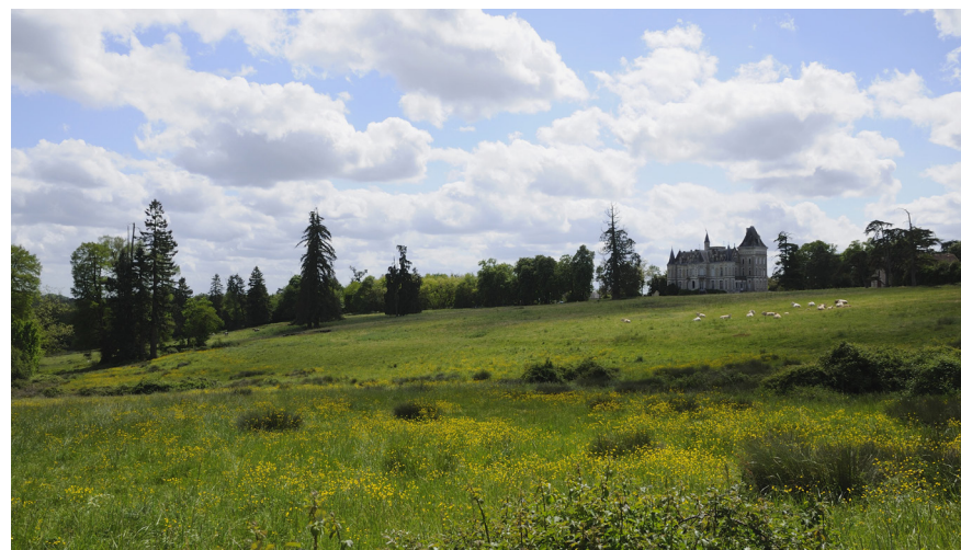
Domaine du Châtelard