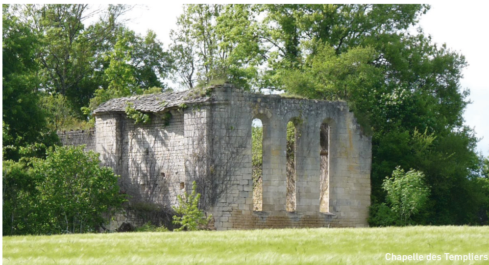
Chapelle des Templiers

9 Revenez sur le Hameau du Temple, par le chemin en plein champ, pour rejoindre le parking par la D116.