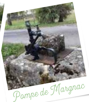
Pompe de Margnac

08 - À la sortie du chemin, suivre la route vers la droite. Avant la première maison de gauche, monter les petites marches aménagées dans le talus. Longer la muraille du logis de la Motte et arriver à une route - prendre le temps de faire un tour dans les villages de la Motte et de chez Forgeau et revenir sur ses pas. Traverser et poursuivre tout droit sur le chemin pendant 500m.