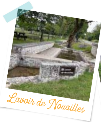
Lavoir de Nouailles